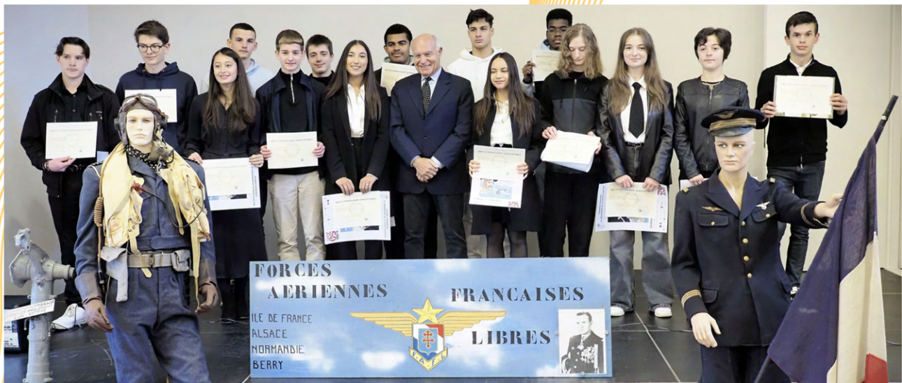
Exposition réalisé par M Barbe et M Gilbert

Cette année, la commune de Ronquerolles recevait les lauréats au BIA 2024 de la promotion « Pierre Clostermann ». 16 participants se sont préparés à ce brevet, et tous ont été récompensés.