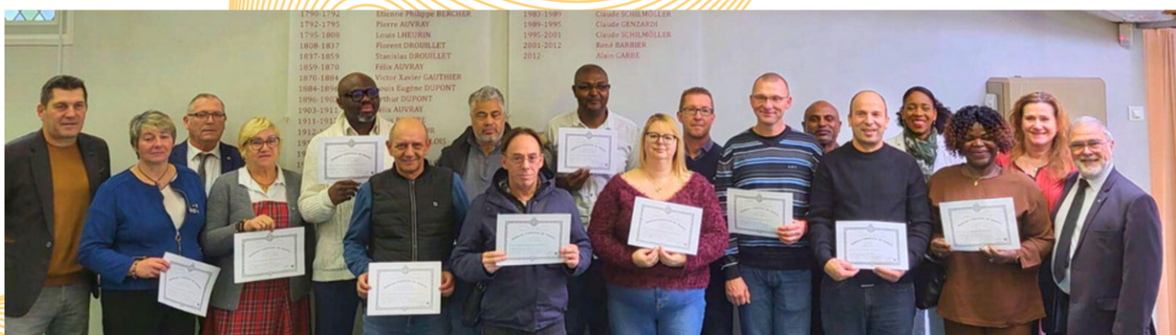
9 Argent, 1 Vermeil, 2 Or et 1 Grand Or